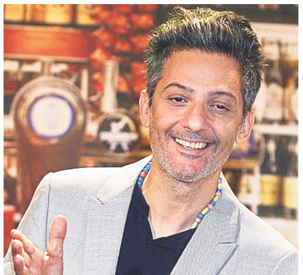
«Volevo fare il calciatore».

Nonostante tutta la fama di cui gode, anche lui ha qualche rimpianto. «Tornando indietro darei più importanza allo studio, anche se allora avevo la necessità di guadagnare e dovevo lavorare. È importante essere curiosi. Personalmente quando mi capita che un amico citi un libro che non conosco corro subito a informarmi o a leggerlo».